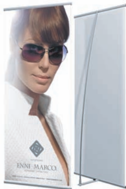
SG11b banner (0.85 2.15 m)